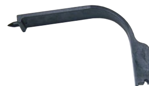
Setzwerkzeug für Kralle