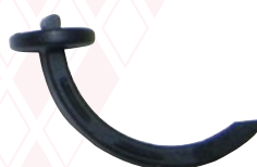
Kralle für Noppenfolie/Klett-TPK-System